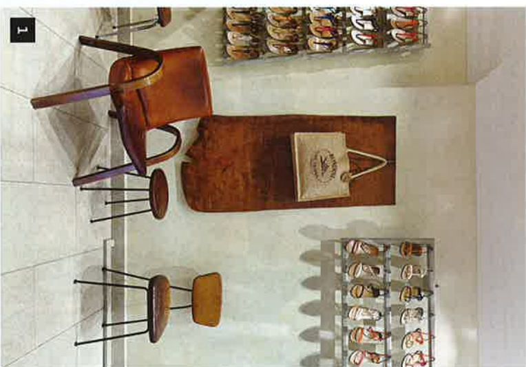
1 ATELIER RONDINI Der Schuh-Himmel liegt in Saint-Tropez, dort werden die Sandales Tropéziennes seit drei Generationen gefertigt www.rondini.fr 2 JEAN-COCTEAU-AMPHITHEATER 1962 schuf der Künstler diesen Ort in Cap-d'Ail

Wänden des Speiseraums geklaut wurden, hat die Anziehungskraft noch verstärkt. Die Werke sind längst wieder aufgetaucht. Und statt Picasso kommt heute Christo vorbei, um zwischen der beeindruckenden Sammlung schörkellose provenzalische Küche zu genießen. So lebt der Mythos weiter. Wer Teil davon sein möchte, muss allerdings im Sommer Wochen im Voraus reservieren.